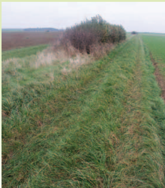
Îlot arbustif sur bande enherbée