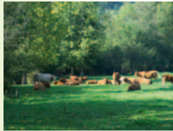
Haie et troupeau