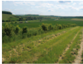
Haie brise vent implantée en 2007